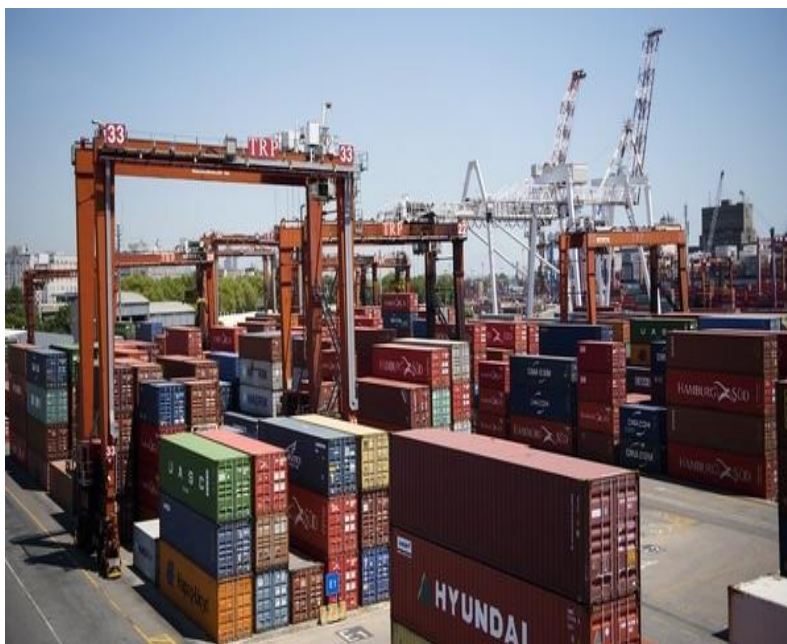
La deficiencia para exportar es la principal limitante para el crecimiento y el progreso social

El principal problema económico en Argentina, no es la inflación, ni el déficit fiscal, ni el endeudamiento. Tampoco la pobreza, la desigualdad o el desempleo, que no son problemas sino dolorosas consecuencias de un sistema que no funciona como debería.