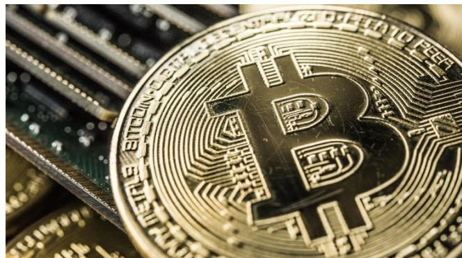
El diseño intelectual de bitcoin.

bancarias y por lo tanto no existe riesgo alguno de que esta información le sea sustraída al vendedor