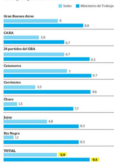
LAS CIFRAS DE LA DESOCUPACIÓN Tasa según organismo, 3º trimestre de 2015