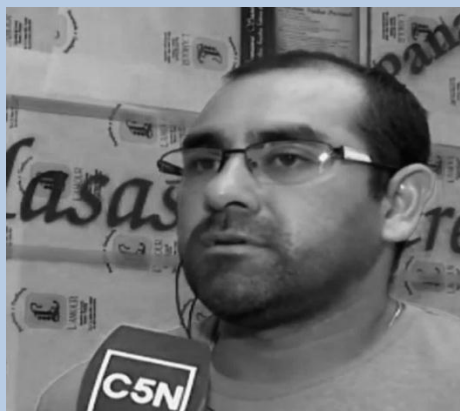
Testimonio de un Panadero

Abrir hoy la panadería para mí es perder plata, sostuvo el dueño de L'Amour quien luego de 30 años en el mercado cierra sus puertas al público. Ubicada en la ciudad de Buenos Aires.